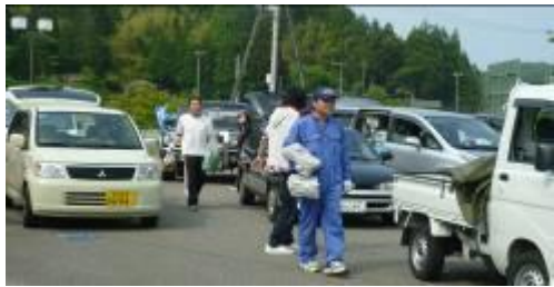
運搬車両が混んでくると縦列駐車になるので要注意！