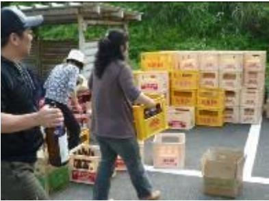
〈ビンはケースへ、段ボールは折り畳みビニール紐でしばる〉