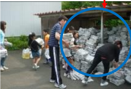
〈新聞紙は自転車小屋内側に上手に積む…量が多い〉