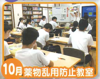
10月 薬物乱用防止教室