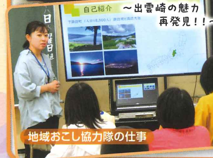
地域おこし協力隊の仕事