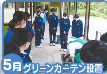
5月 グリーンカーテン設置