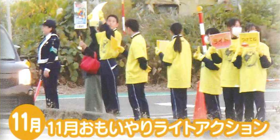
11月 11月 おもいやりライトアクション