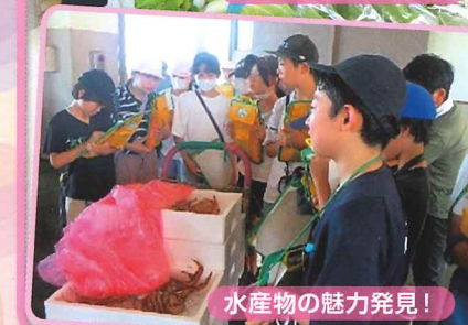
水産物の魅力発見！