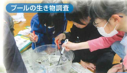
プールの生き物調査