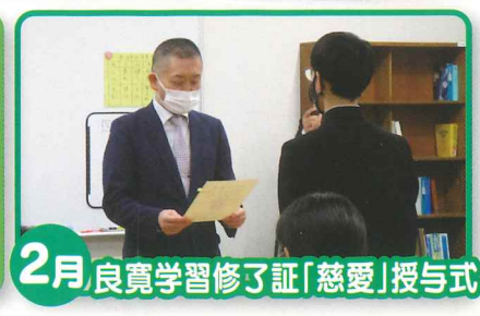
2月 良寛学習修了証「慈愛」授与式

出雲崎町の各事業所や良寛ゆかりの地を訪れ、自然、産業、文化など町の歴史や現在を学びました。