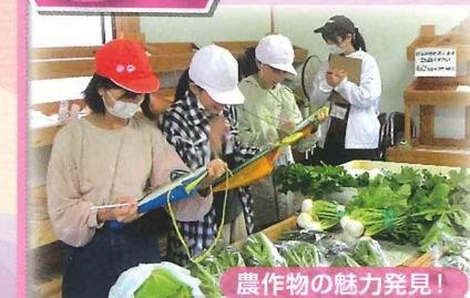
農作物の魅力発見！

漁港や市場などを見学を通して、出雲崎の特産物や郷土料理などの食に関する魅力をたくさん発見しました。また、地域の方々に力を貸していただきながら、米作りに挑戦しました。私たちの町には、まだまだ知らなかった魅力がたくさんあることに気づき、「これをより多くの人に広めたい」という思いを強くしました。出雲崎の食の魅力を詰め込んだパンフレットと育てたお米を様々な施設へ届けに行き、様々な地域の方々と交流することができました。