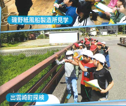
磯野紙風船製造所見学