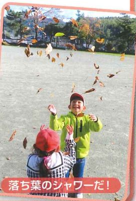
落ち葉のシャワーだ！