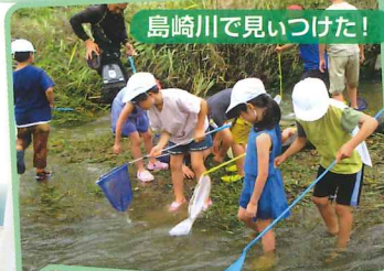
島崎川で見つけた！