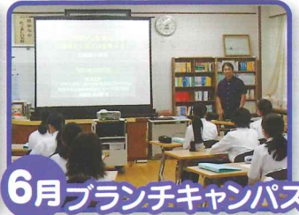
6月 ブランチキャンパス