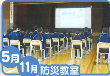
5月 11月 防災教室