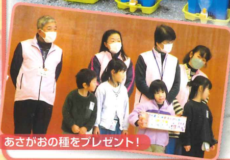
あさがおの種をプレゼント！

春はあさがおとさつまいもを育て、夏は水遊びと泥遊びをしました。秋は落ち葉で遊び、収穫したさつまいもを堪能。冬は雪遊びで大盛り上がりでした。あさがおの種を、ありがとうの花と一緒に地域の皆さんにお届けすることができました。1年間を通して、出雲崎の豊かな自然を楽しみました。