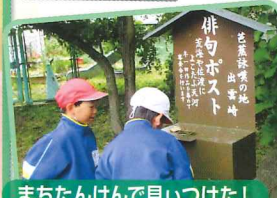
まちたんけんで見つけた！

親子で「梅もぎ体験」や「梅シロップ作り」を行い、地域の恵みを感じました。「町探検」では、地域にあるお店を訪問し、町で働く人の思いを知りました。「島崎川生き物調査」では、島崎川に生息する生き物をたくさん見つけました。これらの経験を通して、一人一人が出雲崎町のすてきや魅力を見つけることができました。