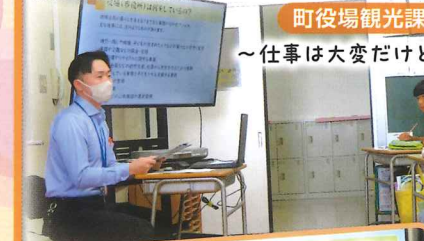
町役場観光課の仕事

6年生は、キャリア教育で様々な職種の方から仕事の話や人生で大切にしていることについて話をいただきました。「夢のきっかけは、そこら中に転がっていること」「チャレンジしてみるという気持ち」「いくつになっても、学び続ける大切さ」など、出雲崎に生きる人生の先輩方から教えていただきました。児童たちにとって、自分の将来を考えるきっかけになったと思います。