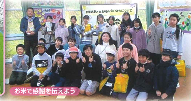
お米で感謝を伝えよう