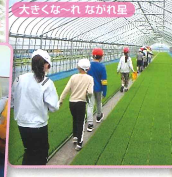
大きくな～れなれ星