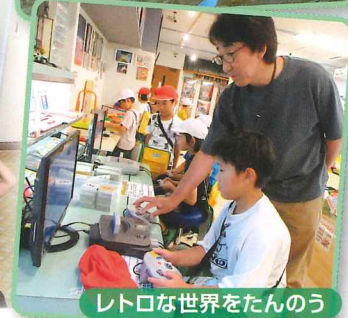
レトロな世界をたのう