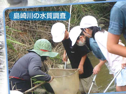
島崎川の水質調査