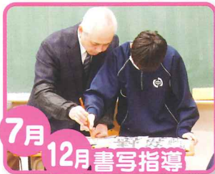
7月 12月 書写指導