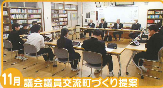
11月 議会議員交流町づくり提案