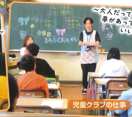
児童クラブの仕事