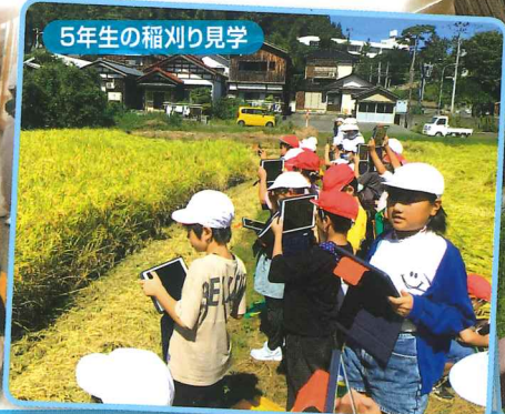
5年生の稲刈り見学