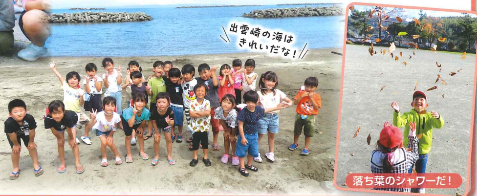
出雲崎の海はきれいだな！