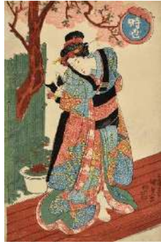
「時世」歌川国貞 文政後期 ／中右コレクション

期 日：4/20(土)～6/9(日) 休 館 日：毎週月曜日(祝日の場合は翌平日) 開館時間：9:30～17:00 (観覧券の販売は16:30まで) 会 場：県立歴史博物館 企画展示室 (長岡市関原町1-2247-2) 観 覧 料：一般840円、高校・大学生600円、 中学生以下無料