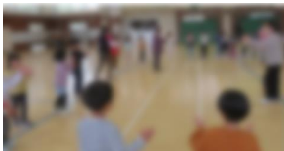
5/8 1年生 出雲崎おけさ講習 《出雲崎おけさ保存会》

交通安全教室や運動会「出雲崎おけさ」講習会における指導、子供たちの遊びと学びのフィールド「ほなみが丘」の環境整備など、本年度初めも保護者・地域の皆様のご支援をいただき、充実したスタートを切ることができました。心より感謝申し上げます。