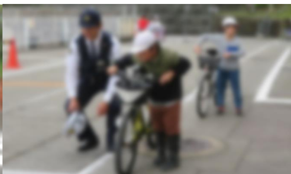
4/25 交通安全教室 1・2年歩行講習、3・4年自転車講習 《与板警察署、出雲崎駐在所、交通安全協会、女性ドライバーの会、自転車組合 交通指導員（町委嘱）、町総務課》