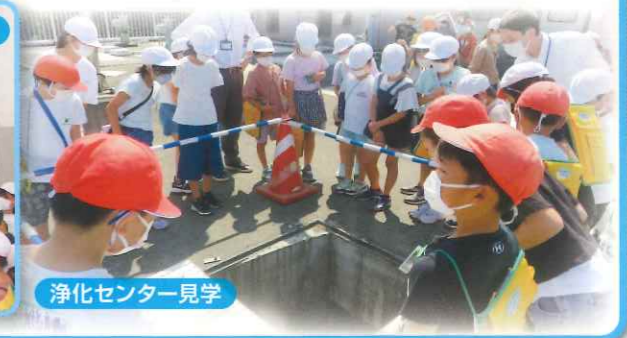
浄化センター見学