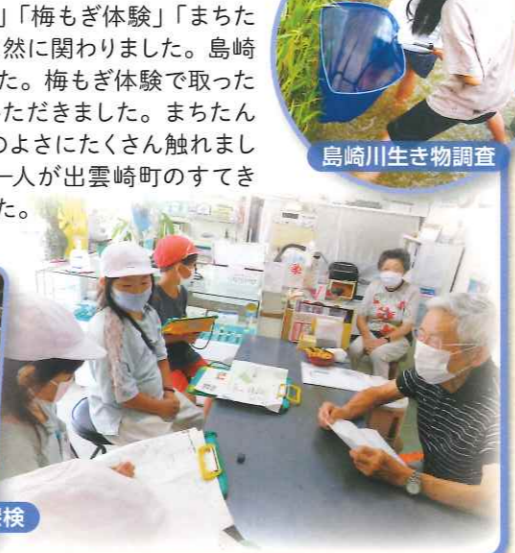
島崎川生き物調査