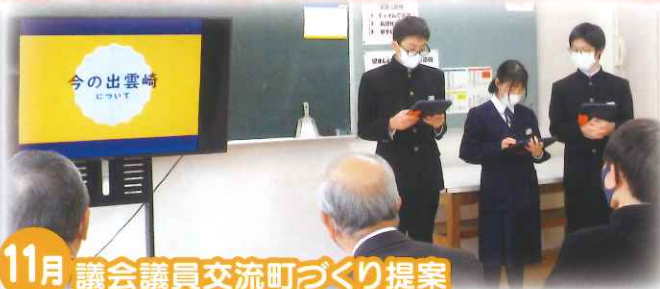
11月 議会議員交流町づくり提案