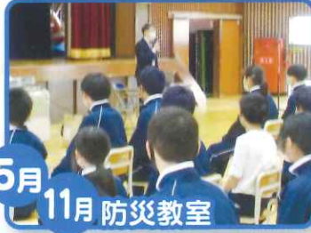
5月 11月 防災教室