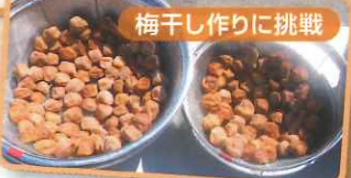
梅干し作りに挑戦

5年生は米づくり体験を通して、お米ができる過程だけではなく、米づくりに関わる方の思いに触れながら、お米の大切さを学びました。