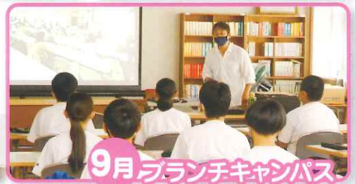
9月 ブランチキャンパス