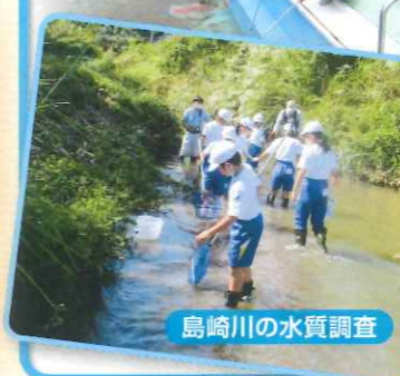
島崎川の水質調査

自分たちでもできることは何かを考え、できることを実践しました。水を無駄遣いしないこと、節水を促すポスターを作成することなど、自分たちができる第一歩を考えました。