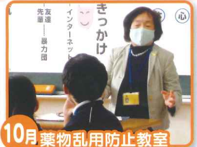
10月 薬物乱用防止教室