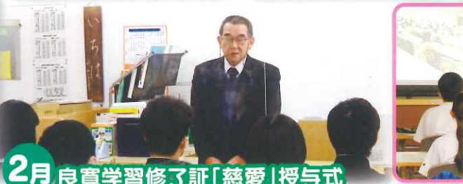
2月 良寛学習修了証「慈愛」授与式