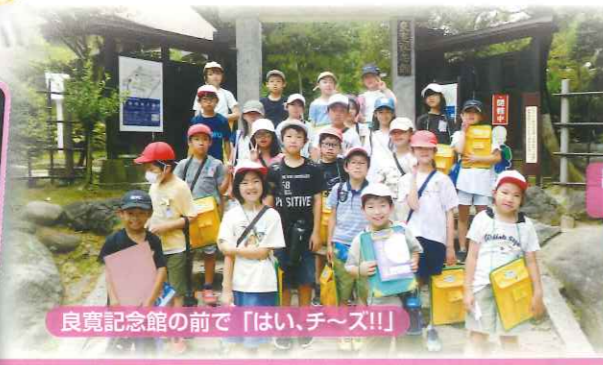
良寛記念館の前で「はい、チ～ス!!」