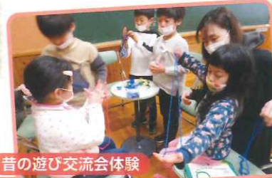
昔の遊び交流会体験