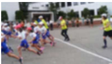
<校内マラソン大会>