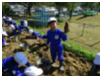
<1年生 サツマイモ掘り>