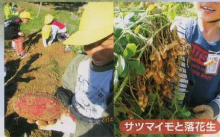
サツマイモと落花生