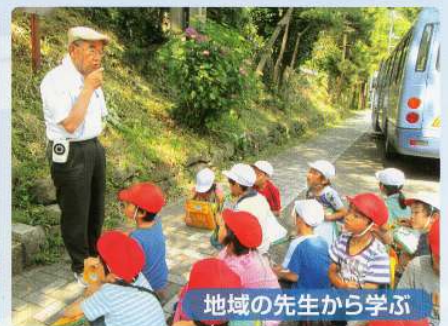
地域の先生から学ぶ