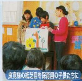
良寛様の紙芝居を保育園の子供たちに