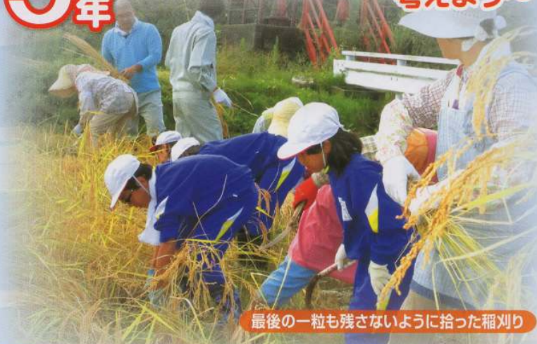
最後の一粒も残さないように拾った稲刈り

米作り体験や学習を通して、たくさんのことを学びました。育苗センターの見学から始まり、田植えや稲刈りを体験しました。農業を使わないアイガモ農法の見学、地域の方々とのかわりや調べ活動を通して、改めて、食を支えている方々の喜びや苦労を感じることができた子供たちです。毎日、当たり前前に食べているお米や、出雲崎の様々な食の恵みに感謝する貴重な機会となりました。