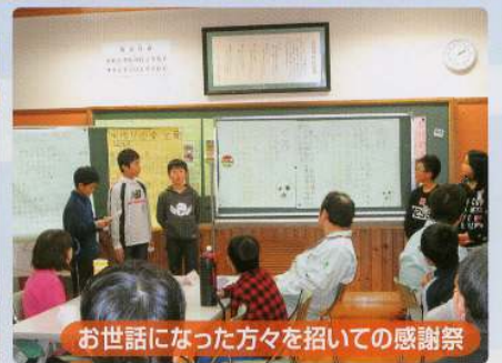
お世話になった方々を招いての感謝祭