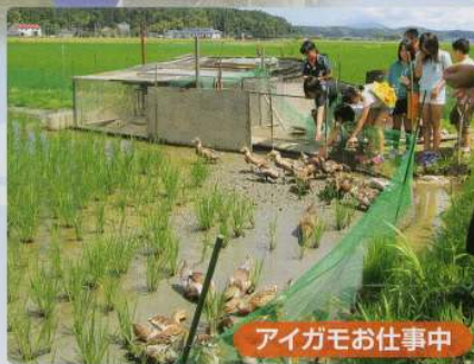
アイガモお仕事中