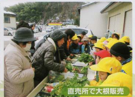
直売所で大根販売