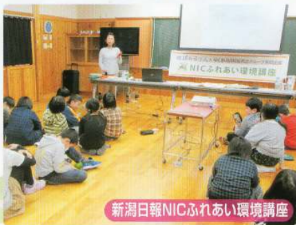
新潟日報NICふれあい環境講座