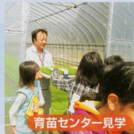
育苗センター見学