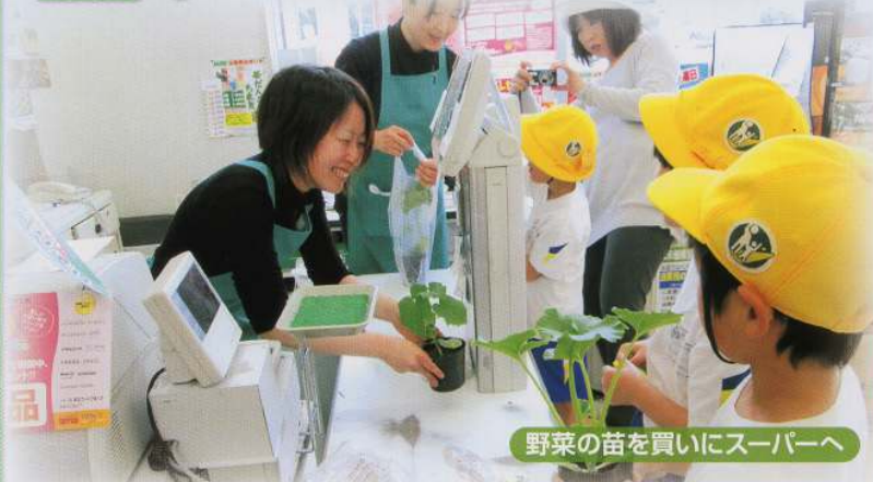
野菜の苗を買いにスーパーへ

出雲崎の特産の梅もぎを体験し、その梅でジュースを作りました。地域の方々の気持ちがこもった梅ジュースを大切に味わいました。