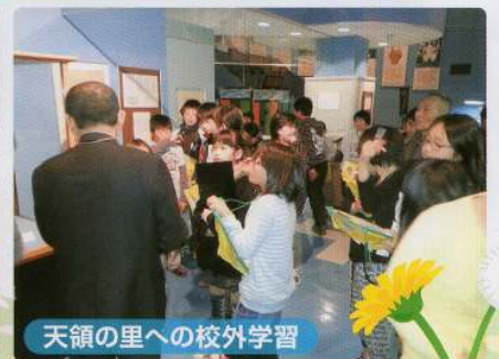
天領の里への校外学習