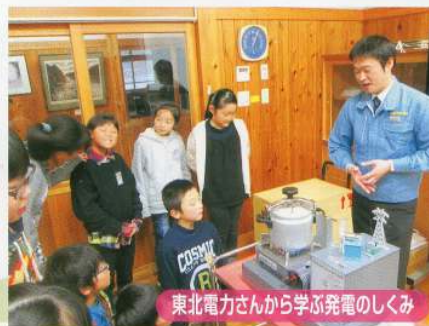
東北電力さんから学ぶ発電のしくみ