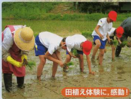
田植え体験に、感動!