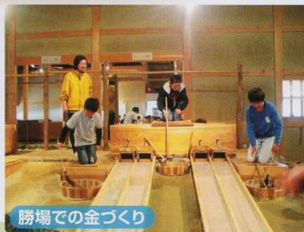
勝場での金づくり