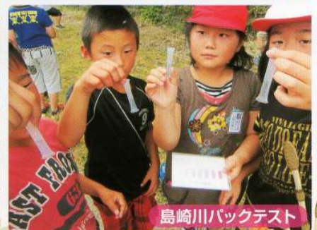
島崎川バックテスト