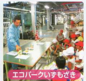
エコパークいずもざき