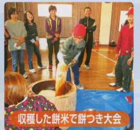
収穫した餅米で餅つき大会