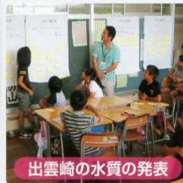
出雲崎の水質の発表