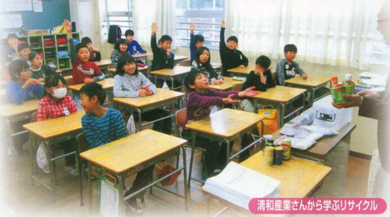
清和産業さんから学ぶリサイクル

出雲崎の川の水質検査や水生生物調査。環境を守るために厳重な水質処理をしている「エコパークいずもざき」の学習。環境を考えたエネルギーの使い方を学んだ東北電力の見学。これらの体験や学習を通して、出雲崎の環境を守るために、多くの人の努力があることを知りました。また、自分たちが日頃行っているリサイクルも、環境をよくするためにどれだけ効果的であるかも分かりました。