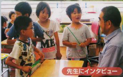
先生にインタビュー