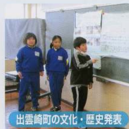
出雲崎町の文化・歴史発表