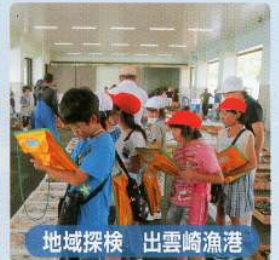
地域探検 出雲崎漁港