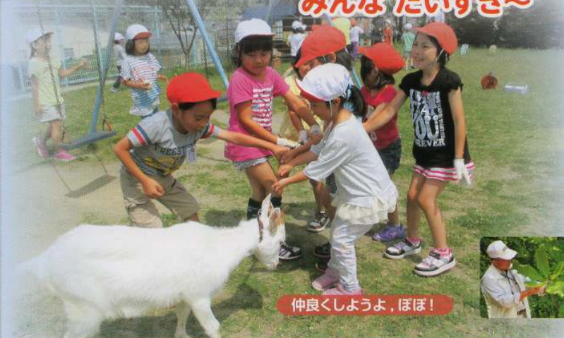
仲良くしようよ、ほぼ！

春：ほなみが丘の散策。夏：井鼻海岸での海遊び。 秋：落花生とさつまいもの収穫。冬：越後丘陵公園でのソリ遊び。約半年間、子ヤギの飼育にもチャレンジしました。どれも地域の方々の温かい手を借りて、たくさんの素敵な体験でした。ご協力に感謝します。